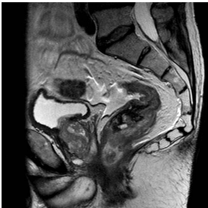
Slika 1 in 2: Izhodiščni MR rektuma pred začetkom zdravljenja (julij 2018).

Oseminšestdesetletni bolnik je bil prvič obravnavan na Onkološkem inštitutu v Ljubljani julija 2018 zaradi suma na papilarni karcinom ščitnice. Po vseh potrebnih zamejitvenih preiskavah je bilo predvideno zdravljenje s totalno tiroidektomijo. Sočasno je bil bolnik obravnavan v Splošni bolnišnici Celje (SB Celje) zaradi težav z odvajanjem blata, in sicer zaradi pogostih tekočih odvajanj blata s primesjo krvi in uhajanja blata. Postavljena je bila diagnoza adenokarcinoma rektuma na globini 7 centimetrov, kliničnega stadija T4 N0 M0, MRF+ (s tumorjem preraščena mezorektalna fascija), EMVI+ (prisotna ekstramuralna venska invazija). Vrednosti tumorskih markerjev pred začetkom zdravljenja sta bili CEA 520 in CA 19-9 5974. Bolnik je bil v dobri splošni kondiciji, brez redne terapije, v zadnjih petih mesecih je shujšal 10 kilogramov. Konec avgusta 2018 je bil pregledan v radioterapevtski ambulanti, kjer je bil sprejet dogovor za začetek zdravljenja s TNT XELOX. Zaradi hudih težav z odvajanjem blata je pred začetkom zdravljenja potreboval razbremenilno kolostomo. Opravljena je bila tudi konzultacija s kirurgom, pri katerem je bil voden zaradi papilarnega karcinoma ščitnice. Dogovorjeno je bilo, da je potrebno primarno zdravljenje lokalno napredovalega adenokarcinoma rektuma, nato pa totalna tiroidektomija. (Sliki 1 in 2)