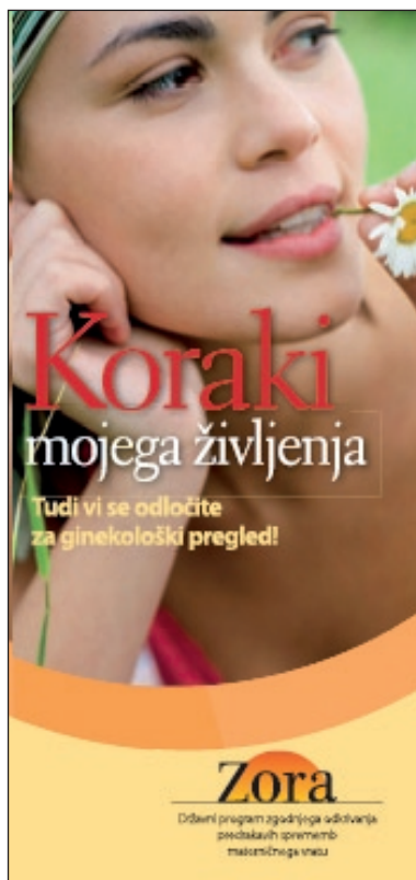
Slika 1. Prva stran zgibanke Programa ZORA.

tudi minimalno tveganja za nastanek raka materničnega vratu. Prav zato priporočamo, da se jemanje brisov materničnega vratu začne šele po začetku spolnih odnosov. Z odvzemom brisa materničnega vratu namreč odkrivamo spremembe celic materničnega vratu, ki jih povzročajo HPV. Pri ženskah, ki še niso imele spolnih odnosov, je kakovosten odvzem brisa materničnega vratu nemogoč.