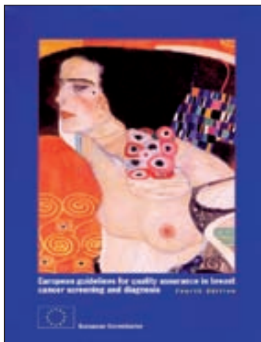
Slika 1. Četrta izdaja Evropskih smernic za zagotavljanje kakovosti presejanja in diagnoze raka dojke.

Žensko v presejalnem centru sprejme zdravstveni administrator, radiološki