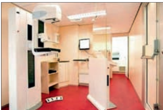
Slika 4. Notranost mobilne presejalne enote.

izkušenosti. V primeru nesoglasij in kadar oba označita pozitiven izvid, se na tedenskih sestankih oba odčitovalca in odgovorni radiolog s konsenzom odločijo o nadaljnji obdelavi posamezne ženske. Odgovorni radiolog nato opravi nadaljnjo obdelavo, ki vključuje neinvazivno (povečava, kompresija, druge projekcije, ultrazvočni pregled) in invazivno diagnostiko (debeloigelna biopsija). Odgovorni radiolog mora biti izkušen v mamografskem odčitavanju in v vseh metodah nadaljnje diagnostike.