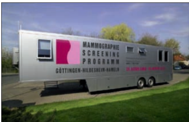
Slika 3. Mobilna presejalna enota, ki deluje v okviru presejalnega programa v Nemčiji.